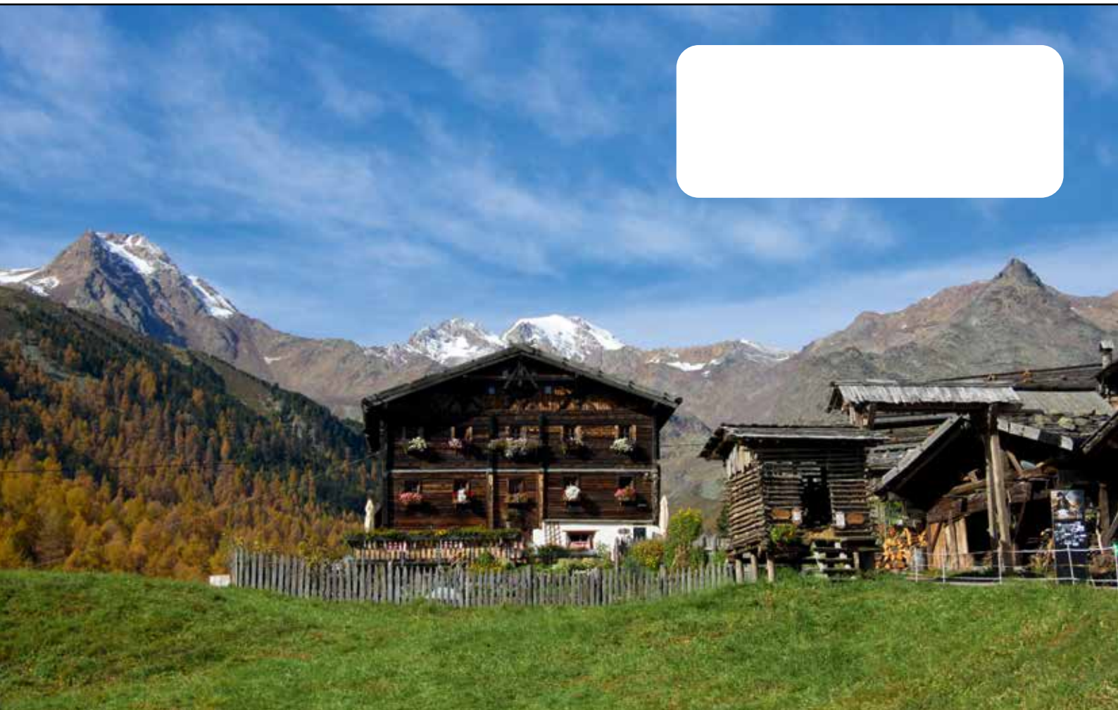
Typischer Schnalstaler Bergbauernhof - Marcheggghof