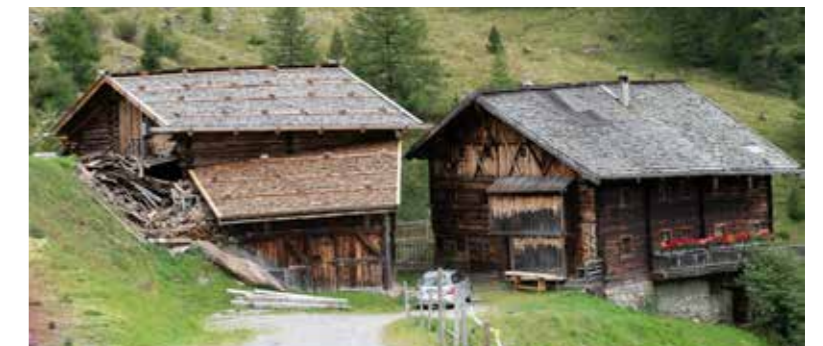
Neues Schindeldach am landwirtschaftlichen Gebäude am Innerkoflhof in Kurzras