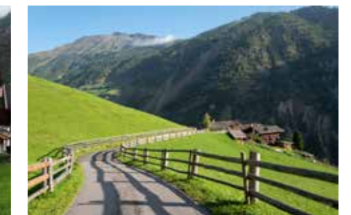
Laufende Instandhaltung des typischen Lattenzaunes mit Beistecken am Sennhof in Karthaus

nachhaltigen Tourismus zu legen. So etwa die mustergültige Sanierung des Obermoarhofes in Katharinaberg, die sich in der Endphase befindet, durch