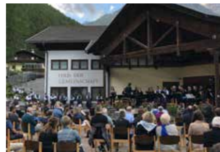
Abendkonzert in Unser Frau