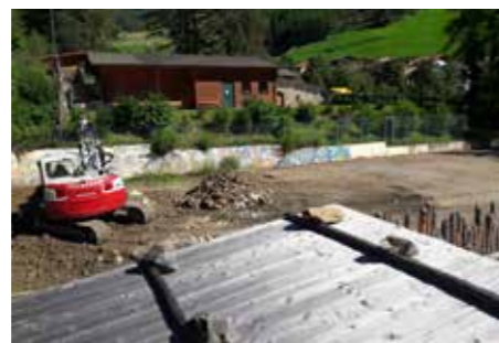
Abschließende Baggarbeiten archeoParc, Foto: Stefan Tappeiner