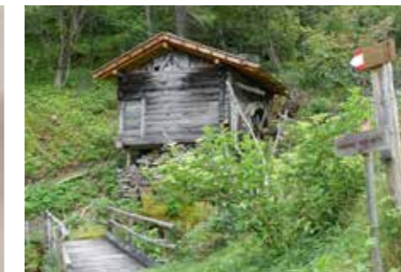
Ein Anfang ist gemacht: ein neues Dach für die Pitairer Mühle. - Foto Monika Gamper

Monika Gamper Grüner Fotos Daniela Brugger