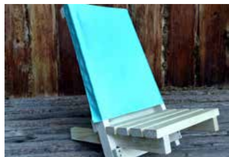
Holzliegestuhl, hergestellt während des Schnalser Kindersommers archeoParc

Bereits zum vierten Mal fand der Schnalser Kindersommer im archeoParc statt. Es wurde wieder fleißig gekocht, Bogen geschossen, Einbaum gefahren, gewerkt und getöpft. Unter der fachkundigen Anleitung von Franz Tapfer haben einige Kinder dieses Jahr ihren eigenen kleinen Liegestuhl gezimmert. Aufgrund der strengen Corona Richtlinien konnten pro Woche nur 7 Kinder am heurigen Kindersommer teilnehmen und auch weitere Sicherheitsmaßnahmen mussten eingehalten werden. Dem Spaß und der Freude der Kinder hat dies aber keinen Abbruch getan. Wir freuen uns bereits auf das nächste Jahr!