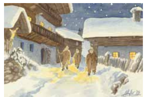
In der Dunkelheit leuchtet hell das Licht

für die Kartenaktion des Bäuerlichen Notstandsfonds kostenlos zur Verfügung gestellt.