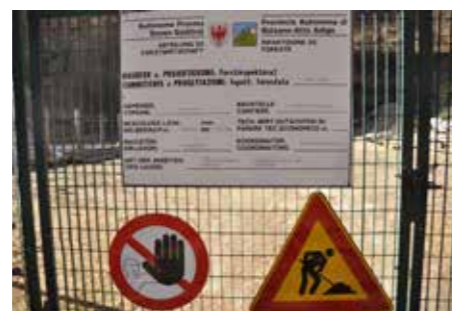
Die archeoParc Baustelle wurde freigegeben.