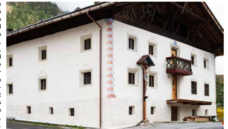
Mustergültige Sanierung des Obermoarhofes in Katharinaberg

Wertvolles Kulturerbe pflegen und für die nachkommenden Generationen erhalten, das sagt sich so salopp. Tourismusbroschüren und Internetseiten der Hotellerie brüsten sich mit intakter Kulturlandschaft, gepflegten Höfelandschaften, urigen Fluren, Gassen, Zäunen und Wiesen. Gäste, die Südtirol als ihre Feriendestination wählen, aber auch wir Einheimische schätzen harmonische und stimmige Kultur- und Naturlandschaften. Leider zu oft wird der Wert des Gewachsenen, des scheinbar nicht mehr Zeitgemäßen nicht erkannt, Kulturgut verschwindet, wird durch Austauschbares, Banales... oft leider auch durch Kitsch... ersetzt. Lange könnte man darüber diskutieren, ob abreißen, planieren, modernisieren oder austauschen wirklich immer die langfristig beste Lösung ist. Als Kultur- und Heimatpflegeverein möchten wir aber nicht die Kritik in den Vordergrund stellen, sondern positive Beispiele im Tal vorzeigen, vom Erhalt wertvollen Kulturerbes berichten und von Menschen dahinter, die diesen Wert für sich und für das Tal erkennen und dafür einstehen. Ihnen gebührt unser aller Dank und unsere Anerkennung. Sie helfen mit, wertvolle Vergangenheit in die Zukunft zu bringen und die Grundlage für wirklich